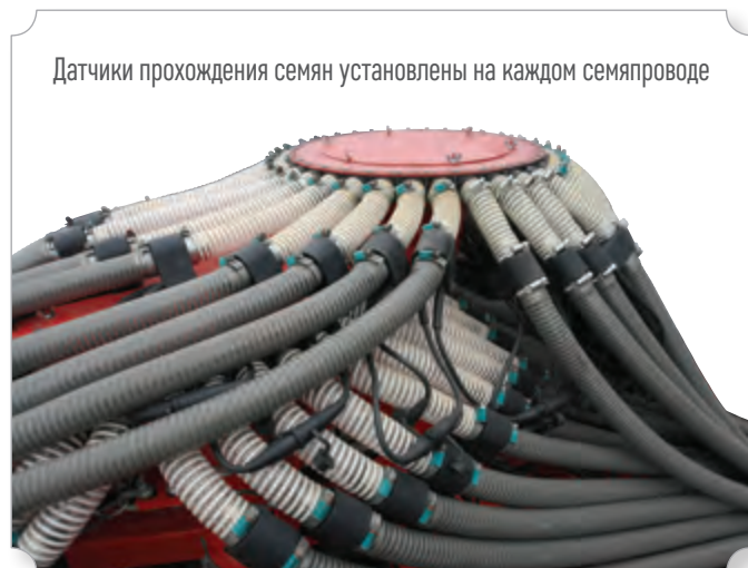
Датчики прохождения семян установлены на каждом семяпроводе