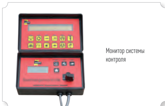
Монитор системы контроля

Система позволяет контролировать уровень заполнения семенного бункера, что оптимизирует логистику при посеве.