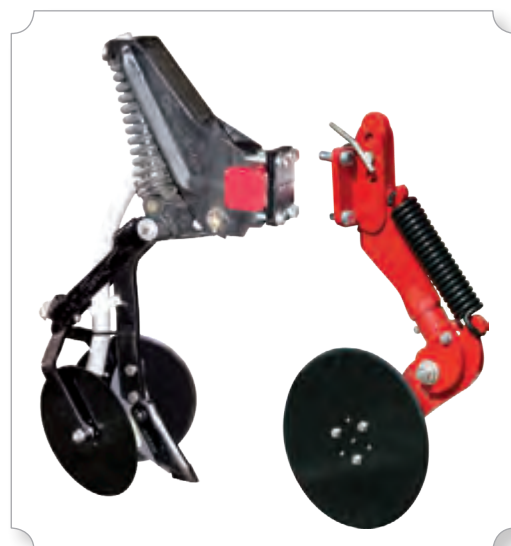
▲ Сошник с блоком безопасности и выравнивающими дисками (слева). Разрезной диск (справа) – опция

Сеялка оснащена блоками безопасности, предохраняющими сошники от поломки. Корпус и пружина блока безопасности не требуют обслуживания и регулировки в течение всего срока эксплуатации сеялки. Усилие срабатывания блоков безопасности составляет 450 кг.